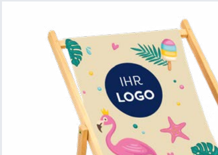
Digitaldruck - vollflächig